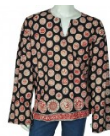
Kurta Homme Chemise...